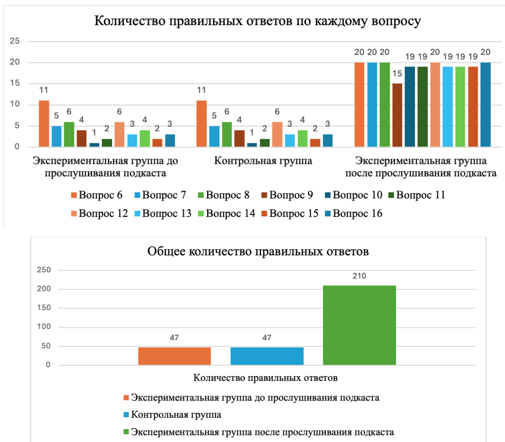
Рис. 7, рис. 8 - Результаты второго анкетирования экспериментальной группы, представленные в виде сравнительных диаграмм с результатами первого анкетирования экспериментальной и контрольной групп