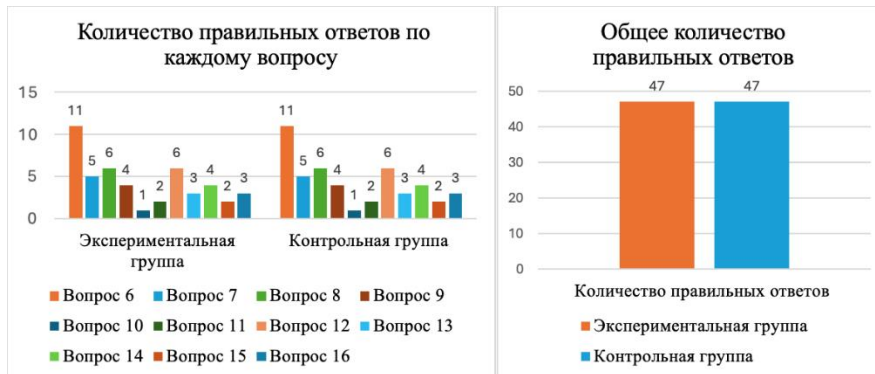
Рис. 3 - Результаты первого анкетирования, представленные в виде сравнительных диаграмм

правовых знаний и отношения к правовой грамотности, показали, что лишь половина респондентов (50 %) корректно определяют понятие «право» как систему установленных государством норм и правил поведения, тогда как 20 % связывают его с возможностью неограниченных действий, а 5 % затруднились с ответом.