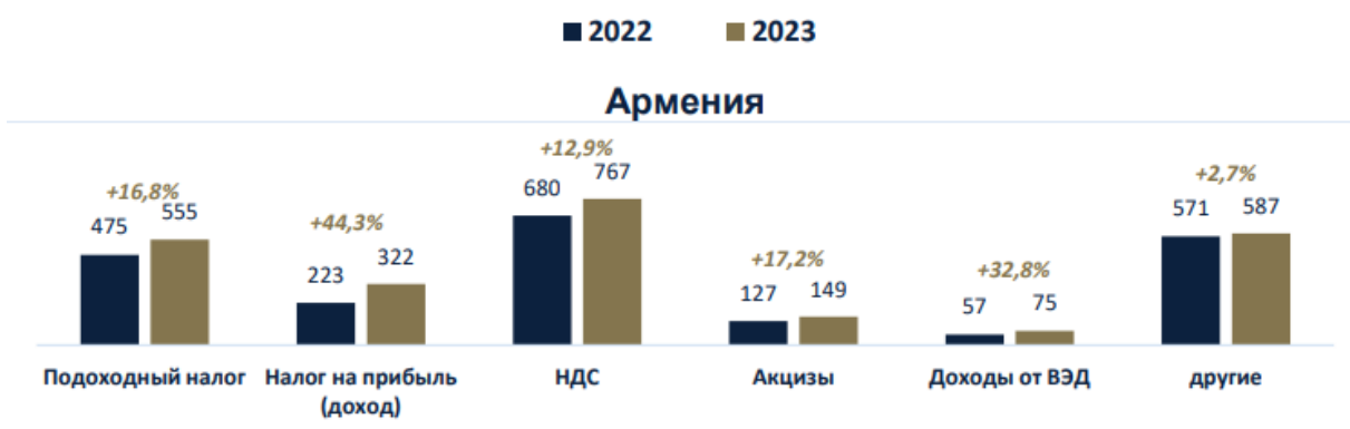
Рисунок 2.3 –Структура и динамика налогов и сборов по Армении (в том числе НДС)

На рис. 2.2 отражена структура и динамика налогов и сборов по Армении (в том числе НДС).