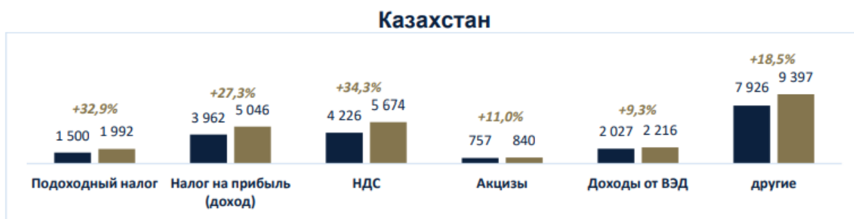
Рисунок 2.4 – Структура и динамика налогов и сборов по Казахстану (в том числе НДС)

Как видно из рисунка, НДС в 2023 году вырос на 12,9%, в структуре НДС в консолидированном бюджете Армении также занимает ощутимую долю. На рис. 2.4 отражена структура и динамика налогов и сборов по Казахстану, в том числе НДС за 2022 и 2023 годы.