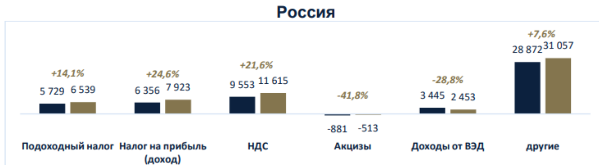
Рисунок 2.6 – Структура и динамика налогов и сборов по Российской Федерации (в том числе НДС)

Армении. На рис. 2.6 отражены структура и динамика налогов и сборов (в том числе и НДС) по России в 2022 и 2023 годах.