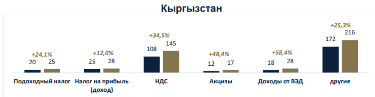
Рисунок 2.5 – Структура и динамика налогов и сборов по Кыргызстану (в том числе НДС)

Здесь наибольший удельный вес занимают другие поступления, однако и прирост НДС ощутим (34,3% в 2023 году по отношению к 2022 году). На рис. 2.5 отражены структура и динамика налогов и сборов (в том числе и НДС) по Кыргызстану.