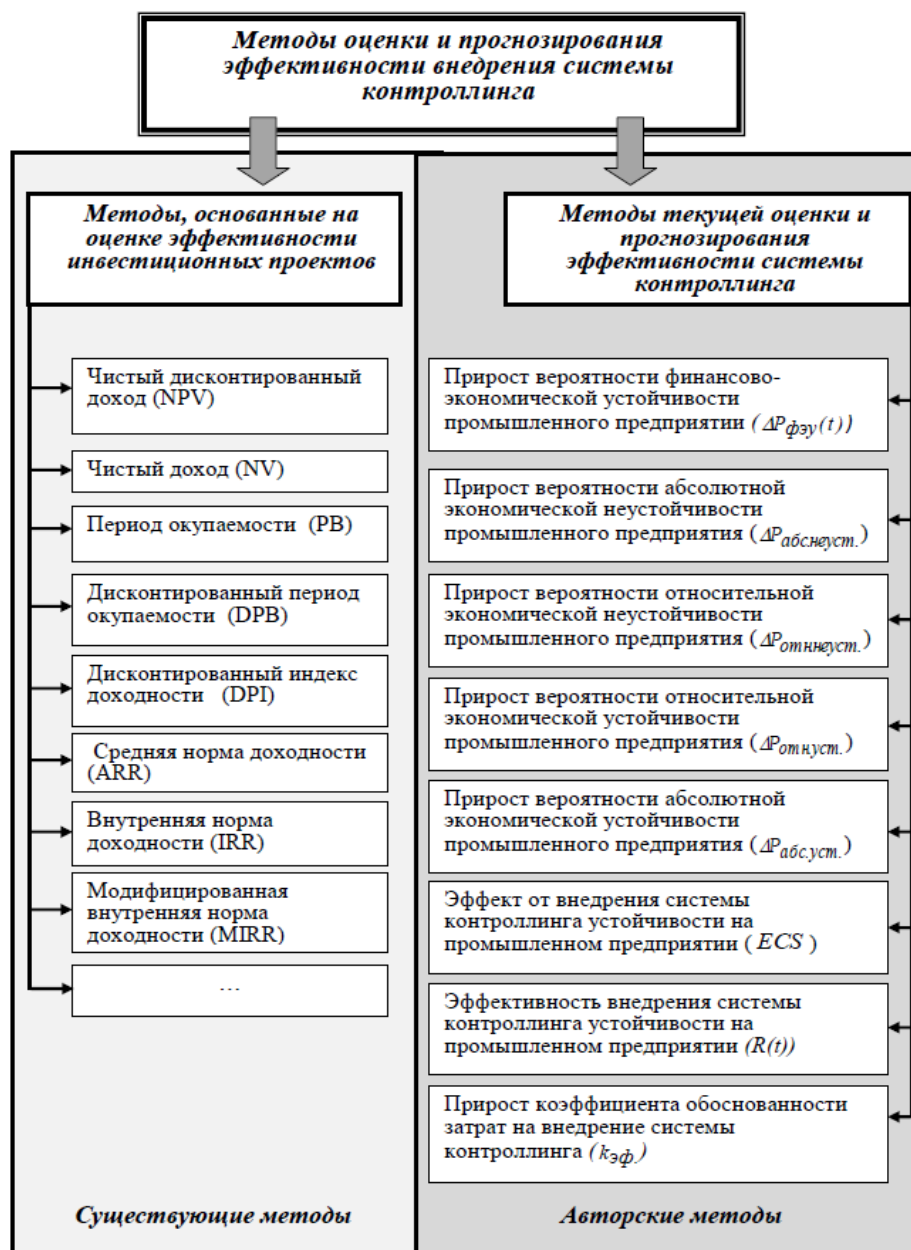
Рисунок 1 – Методы оценки эффективности внедрения системы контроллинга устойчивости промышленного предприятия

Для оценки эффективности этих затрат можно использовать требования инвестиционного анализа и определить такие показатели эффективности, как дисконтированная чистая прибыль, период амортизации, норма прибыли и внутренняя норма доходности (рисунок 1).