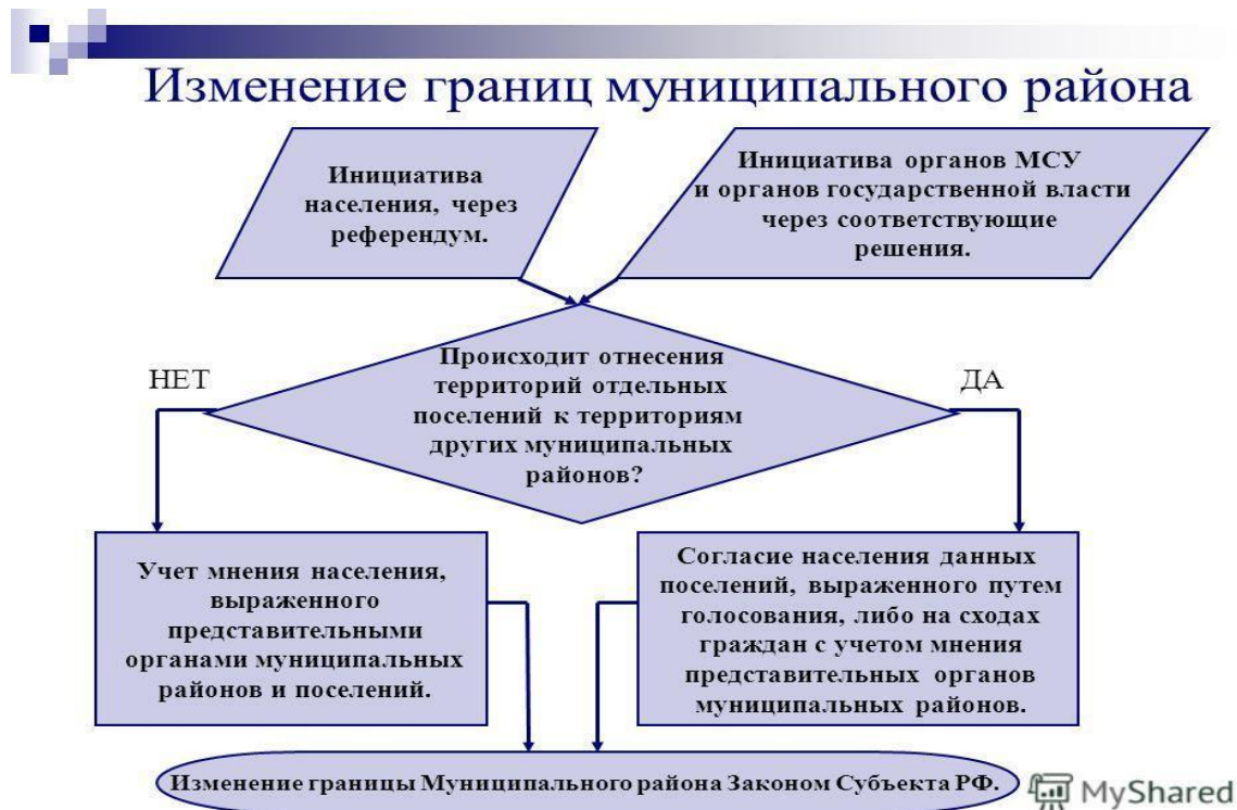
Рисунок 1.1 – Блок-схема изменения границ муниципального района

отношение к инициативе изменения границ поселения.