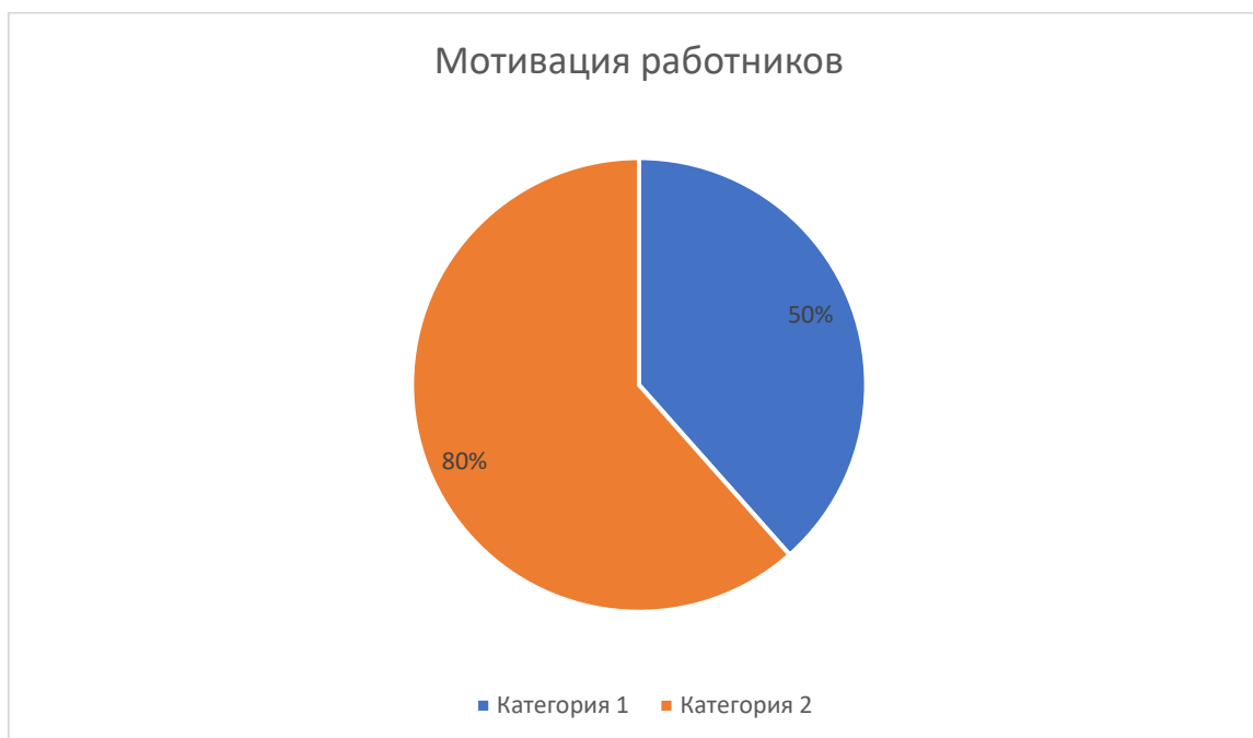
Рисунок 2 – Эффективность работников

Многие современные компании влияют на сферу мотивации сотрудников с помощью нематериального стимулирования, апеллируют к их самосознанию и меняют образ жизни. Например, известные международные европейские компании, например, ZAPPOS, SPLAT, активно используют систему смыслового управления и успешно доносят до сотрудников свою миссию, цели и основные задачи компании в целом и в частности отдельных подразделений [2].