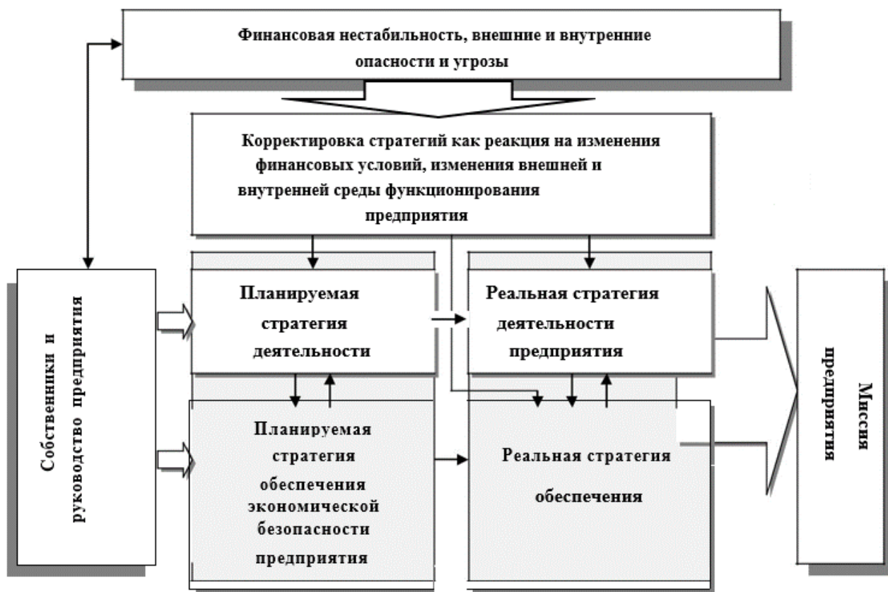
Рисунок 1 – Модель взаимодействия стратегии обеспечения экономической безопасности предприятия с общей стратегией

Следует подчеркнуть, что стратегия обеспечения экономической безопасности предприятия – это не отдельный, оторванный от общих планов предприятия документ, а наоборот – она глубоко интегрирована с его общими планами [3]. Вся деятельность, связанная с обеспечением экономической безопасности предприятия, должна быть синхронизирована с основной деятельностью предприятия. Стратегия обеспечения экономической безопасности должна являться составной частью общей стратегии предприятия. Она состоит из предварительно запланированных и тщательно скоординированных как между собой, так и с общей стратегией предприятия специальных мероприятий, направленных на создание благоприятных, безопасных условий для хозяйственной деятельности. На рис. 1 отражена модель взаимодействия стратегии обеспечения экономической безопасности предприятия с его общей стратегией.