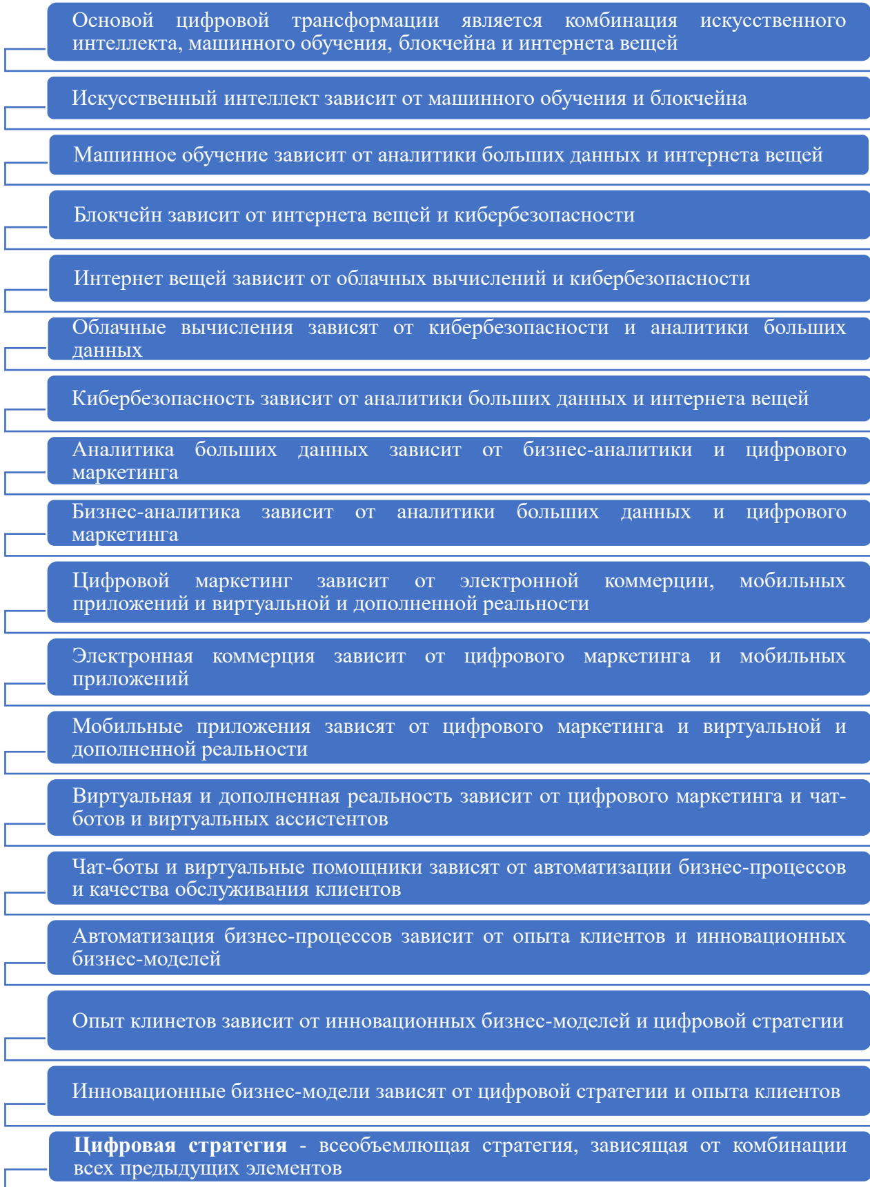
Рисунок 3 – Конфигурации/комбинации и зависимости между цифровыми технологиями и инструментами