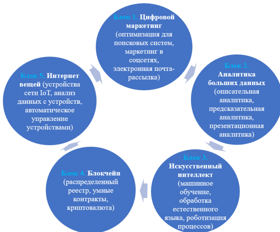
Рисунок 2 – Пример комбинации цифровых технологий и инструментов (цифрового маркетинга, аналитики больших данных, ИИ, блокчейн, IoT)

Рассмотрим второй пример комбинации цифровых технологий и инструментов (цифрового маркетинга, аналитики данных, ИИ, блокчейн, IoT) для создания зоны цифрового влияния на рисунке 2, причем каждый из 5 блоков может быть использован отдельно, а их комбинация создает мощный инструмент для достижения конкурентного преимущества, инновационности и роста чистой прибыли компании.