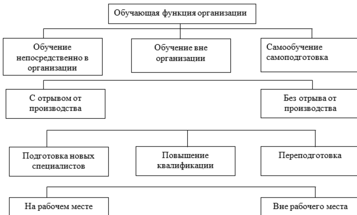
Рисунок 2 – Виды и формы обучения и повышения квалификации работников организации

С точки зрения производственно-технического назначения в обучении работников организации можно выделить: