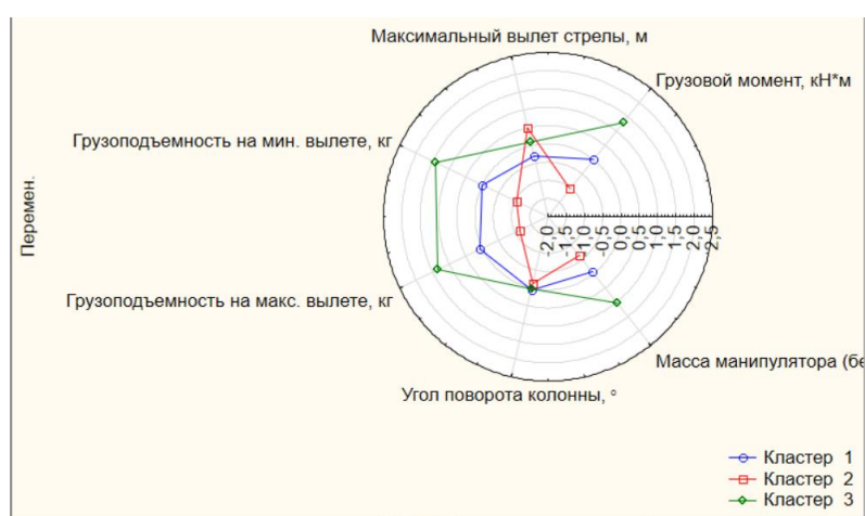
Рис. 4 - Графики средних для каждого кластера

Графики средних показателей значительно отличаются друг от друга, что говорит об успешном разбиении на кластеры.