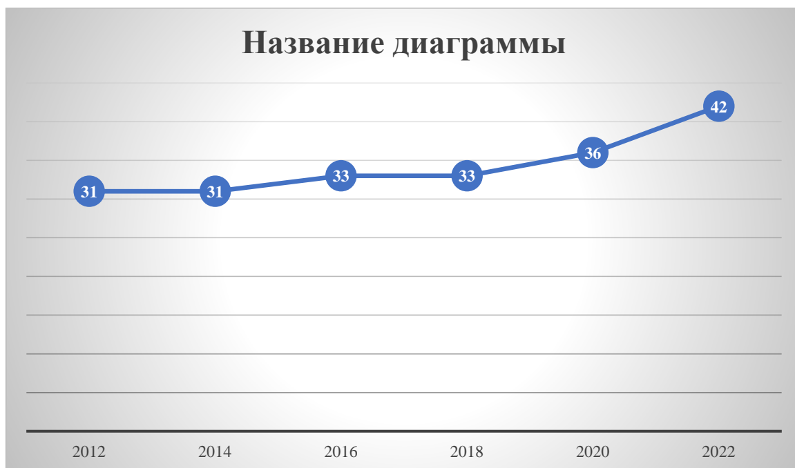
Рисунок 1 - Индекс восприятия коррупции во Вьетнаме за период 2012–2022 гг [10]

За последние 10 лет (2012–2022 гг.) антикоррупционная работа добилась значительного прогресса, достигнув многих очень важных, всеобъемлющих и четких результатов. Судебные органы по всей стране привлекли к ответственности и расследовали 19 546 дел/33 868 обвиняемых, привлекли к ответственности 16 699 дел/33 037 обвиняемых и провели судебные процессы в первой инстанции по 15 857 делам/30 355 обвиняемым за преступления в сфере коррупции, положения и экономики. По состоянию на декабрь 2022 года возбуждено и расследовано более 4200 дел, более 7500 обвиняемым предъявлены обвинения в коррупции, служебных и экономических преступлениях. Только в 2022 году следственными органами Народной общественной безопасности было рассмотрено 687 дел и 1439 обвиняемых в коррупции, из них: 436 новых дел и 929 обвиняемых были привлечены к ответственности [3, с. 13].