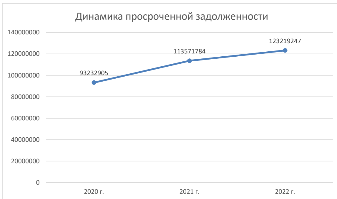
Рисунок 2 – Динамика просроченной задолженности в ПАО «ВТБ» за 2020–2022 гг., тыс. руб.

По прогнозу на 2024 г., динамика роста потребительского кредитования в ПАО «ВТБ» продолжится. Кредитование физических лиц – динамично развивающийся сегмент банковского рынка. Чем больше клиентов у банка, тем больше возможностей для привлечения средств и расширения бизнеса. Кредитование физических лиц стимулирует рост экономики, поскольку увеличивает спрос на товары и услуги, которые физические лица не могут позволить себе купить сразу. Кредитование физических лиц может способствовать развитию малого и среднего бизнеса, который, в свою очередь, создает новые рабочие места и увеличивает ВВП страны.