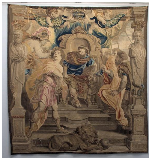
Рисунок 2 – Гнев Ахилла. Шпалера по картону Рубенса

мануфактура, первое промышленное производство ковров, расположенное в пригороде Парижа Сен-Марсель. Появление шпалерной мануфактуры во Франции, стало значимым для страны, которая впоследствии стала законодательницей моды на последующие годы [6].