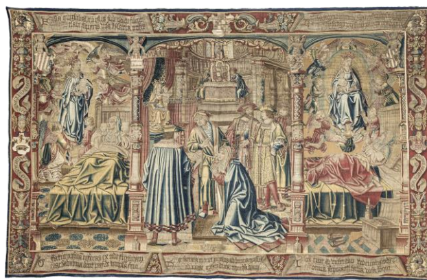
Рисунок 1 – Шпалера «Явление Мадонны»

Первоначально гобелены были доступны только для знати и создавались по заказу на библейские или исторические темы (рис. 1). В интерьерах церкви средневековья они служили одной из иллюстраций к учению верующих. Ткачество чаще всего выполнялось в монастырях и частных мастерских [2].