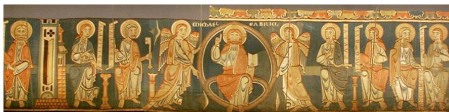
Рисунок 1 – Шпалера Хельберштадского собора: «Христос с апостолами и ангелами»

Церковные шпалеры, согласно своему сюжету, служили библией для бедных, создавались для обучения прихожан и верующих. На церковных шпалерах фигуры изображались без перспективы, где формы отличались простотой, цвета сводились к основным – синему и красному – цвету Средневековья. К первой половине XII века относят образцы из Хальберштадского собора: «Ангелы», «Апостолы», «Карл» (рис. 1.) В готический период храмы стали ядром общественной жизни. Интерьеры готических замков, характеризовались замкнутыми объемами, доминирующими вертикалями, громоздкими масштабами, выразительностью и грубостью форм, что способствовало существенным изменениям в развитии шпалер в этот период.