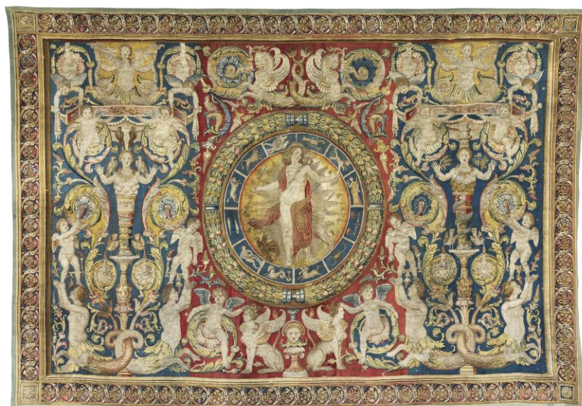
Рисунок 3 – Шпалера «Аполлон и знаки зодиака»

Во время крестовых походов гобелены были привезены в Европу в качестве трофеев. Здесь инновации были восприняты в немецких монастырях и небольших частных мастерских. Затем производство постепенно переместилось в Скандинавию, появилось во Фландрии и Франции. Картины создавались в основном по заказу церкви: это были монументальные произведения с плоским изображением, выполненные в ограниченных, но в то же время довольно ярких тонах.