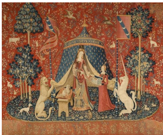
Рисунок 3 – Шпалера «Дама с единорогом»

Вытканые на коврах сюжеты дополняли друг друга, объединенные общей темой. Для каждого зала, комнаты был составлен особый цикл изображений, включавший в себя несколько, например, «Дама с единорогом» – состоит из шести ковров (рис. 3.)