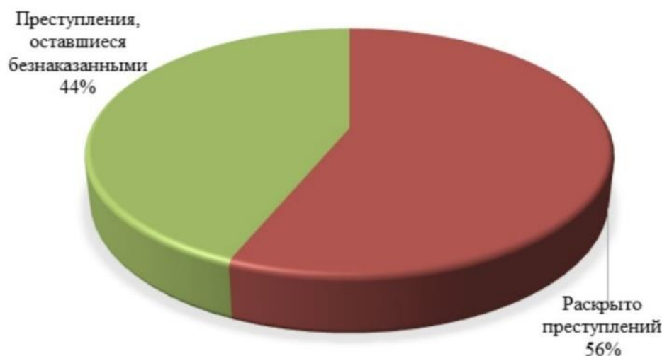
Рисунок 1 - Соотношение раскрытых и нераскрытых преступлений

В январе — июле 2022 года в России было зарегистрировано 11,6 тыс. экологических преступлений, из которых раскрыто всего 6530 (рис. 1), следует из официальной статистики МВД. Среди них учитывается в том числе и браконьерство, подтвердила «Известиям» член Ассоциации юристов России Наталия Скрябина.