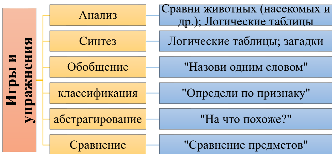
Рисунок 1 – Игры и упражнения [1]

В целях изучения влияния игровой деятельности в рамках психолого-педагогического сопровождения были включены игры и игровые упражнения: