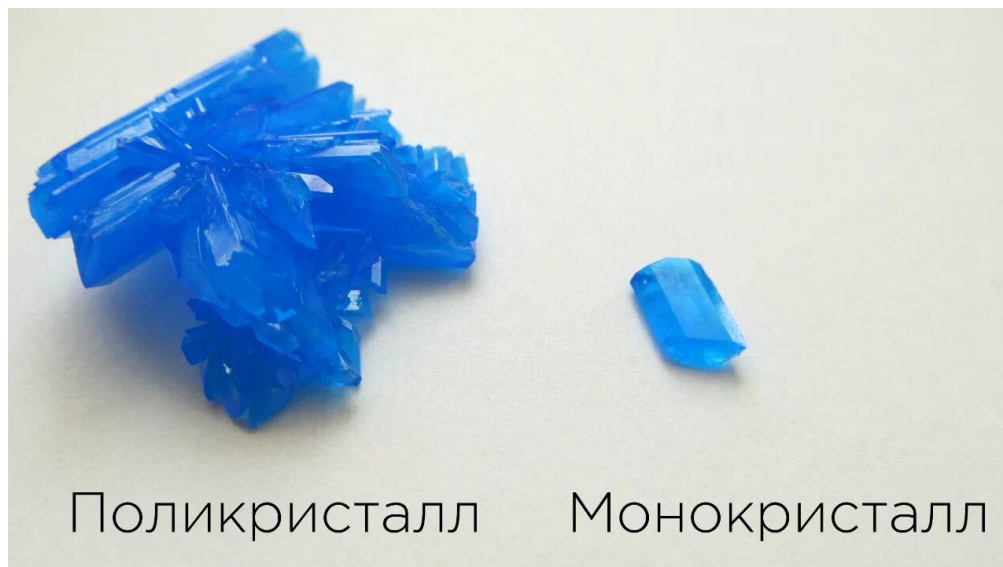
Рис. 1 Отличие монокристаллов от поликристаллов

элементарной ячейкой. Когда периодичность узора распространяется на определенный кусок материала, говорят о монокристалле. Монокристалл образуется в результате роста кристаллического ядра без вторичного зародышеобразования или столкновения с другими кристаллами.