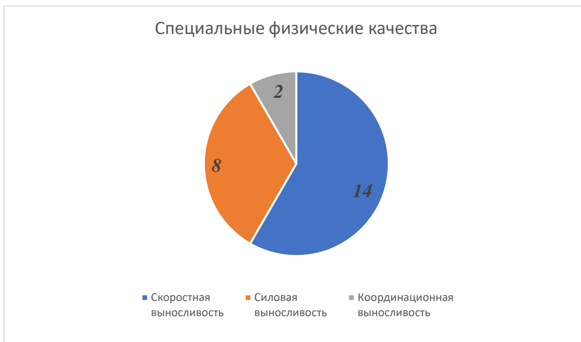
Рисунок 1 - Результаты исследования специальных физических качеств

Таким образом, на основании проведенного нами исследования специальных физических качеств легкоатлетов 15–16 лет на основании анкетирования 8 специалистов в области легкой атлетики (тренеры высшей и первой квалификационной категории) был сделан вывод о том, что ведущим специальным физическим качеством является скоростная выносливость.