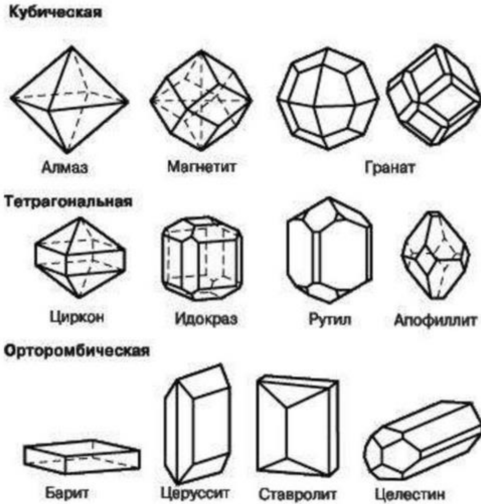
Рис. 4 Кристаллические решётки монокристаллов