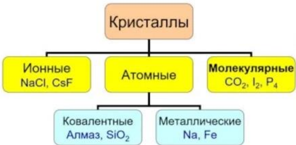
Рис. 4 Классификация кристаллов