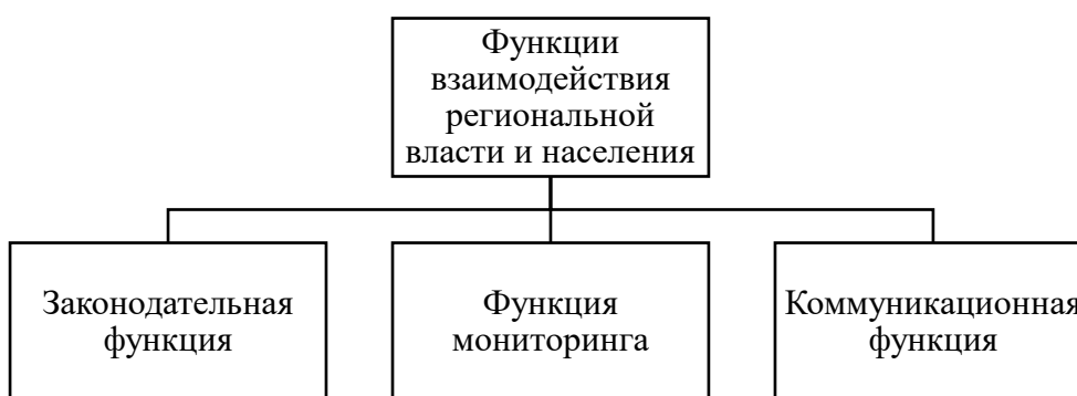
Рисунок 1 - Функции взаимодействия региональной власти и населения

Мониторинг как функция призван обеспечить власть информацией о том, какие в настоящее время в обществе существуют ожидания относительно развития региона, о настроениях населения.