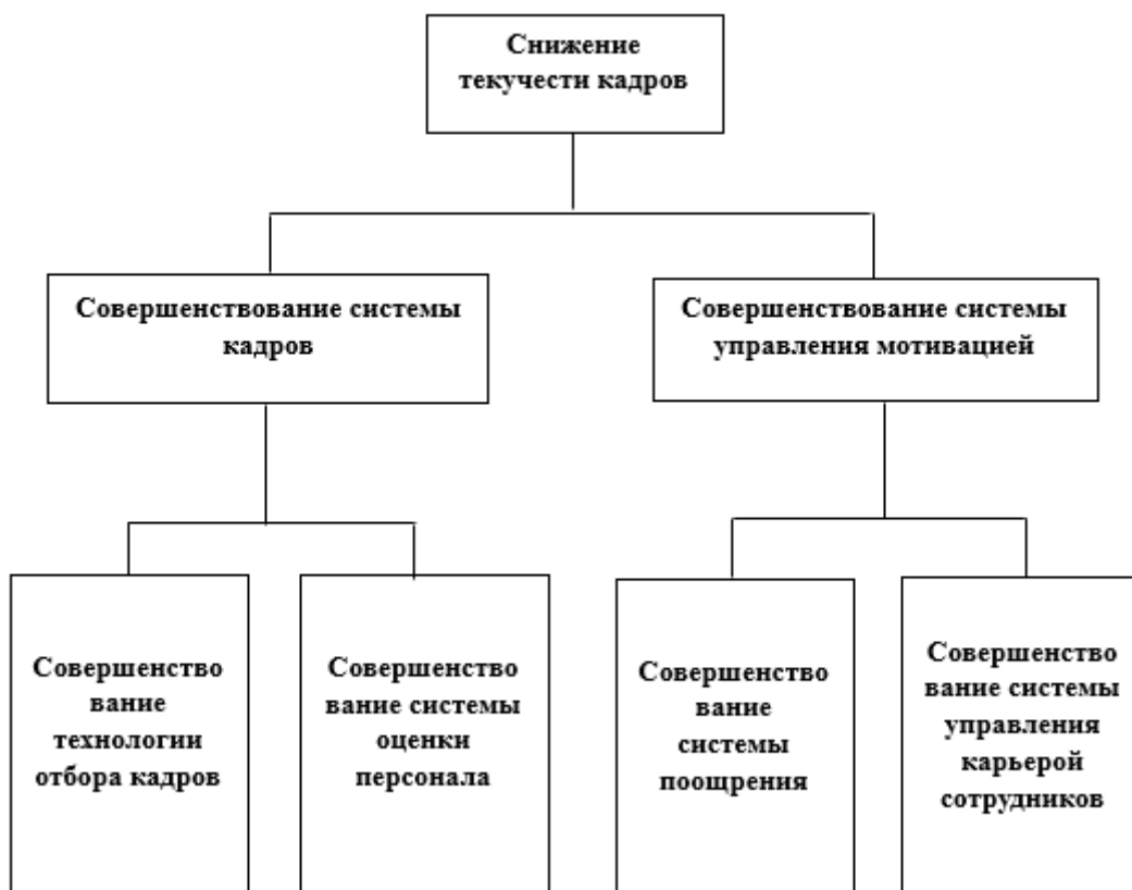
Рисунок 1 – Схема анализа методом «Дерево решений»

метод позволяет строить структуру дерева, состоящей из узлов и листьев, где в каждом узле находятся решающие правила и производится проверка на основе анализа различных факторов, а каждый лист определяет решение для каждого фактора. В простейшем случае, в результате проверки, множество примеров, попавших в узел, разбивается на два подмножества, в одно из которых попадают примеры, удовлетворяющие правилу, а в другое — не удовлетворяющие. Наглядно с деревом решений можно ознакомиться ниже (рис. 1):