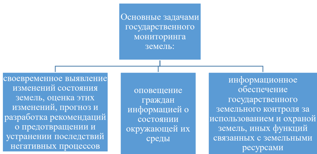
Рисунок 1 – Задачи государственного мониторинга

Для эффективного управления земельными ресурсами требуется вовремя осуществлять государственный мониторинг различных категорий земель, их учет. Получать достоверные сведения о качественном состоянии и правовом положении земель в границах территорий, необходимых для принятия соответствующих решений, направленных на обеспечение эффективного и рационального использования земель (рис. 1):