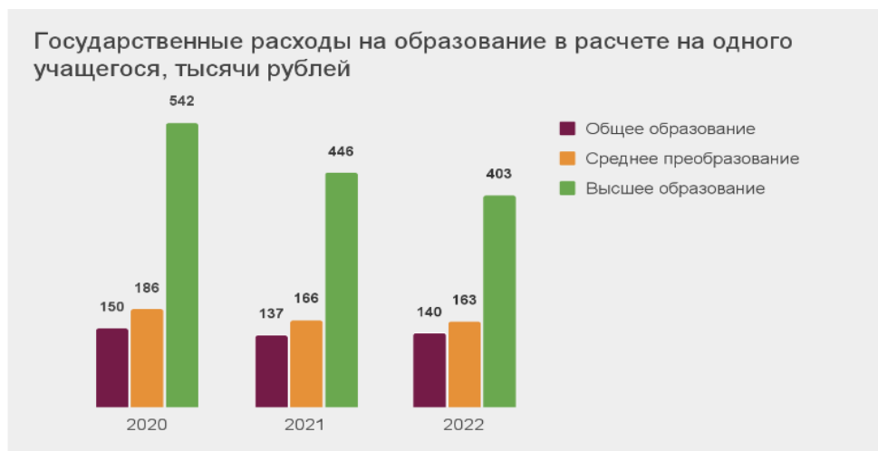
Диаграмма 2 – Расходы на одного учащегося студента

Ретроспективный анализ может показать, какие затраты несет государство за последние 3 года на одного учащегося (студента) (Диаграмма 2).