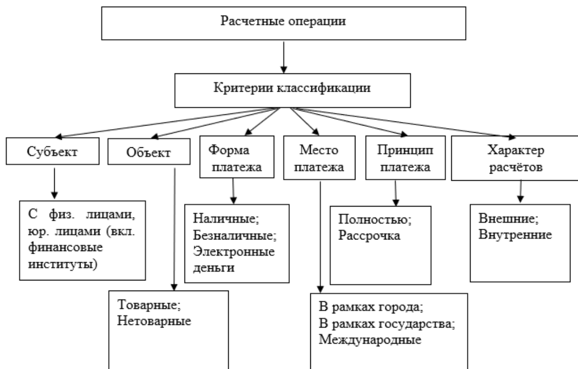
Рисунок 1 – Классификация расчётных операций на современном этапе Примечание – Источник: [2, с. 217].

Для получения необходимой и детализированной информации о расчётных операциях их следует классифицировать по признакам, приведенным на рисунке 1.