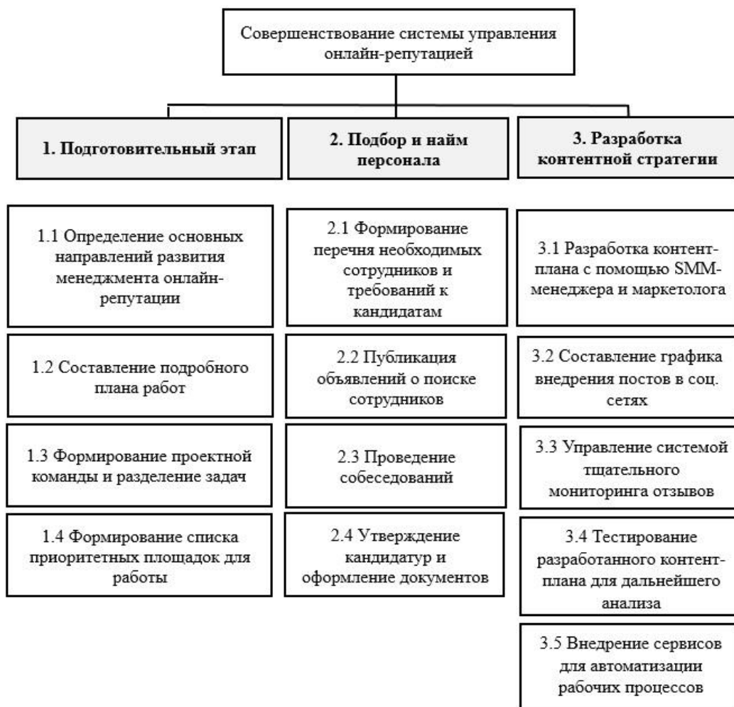
Рисунок 1 – Иерархическая структура работ по проекту

Иерархическая структура работ по предлагаемому проекту представлена на рисунке 1.