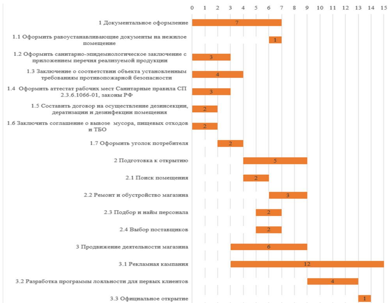
Рисунок 1 – Диаграмма Ганта

Для открытия розничного магазина необходимо несколько раз обращаться в компании по надзору: до аренды помещения, чтобы получить необходимые документы для организации места торговли; после аренды помещения, чтобы контролирующие органы проверили актуальность выполненных требований на соответствие магазина нормам законодательства. Основные этапы открытия розничного магазина можно отследить на диаграмме Ганта (рисунок 1).