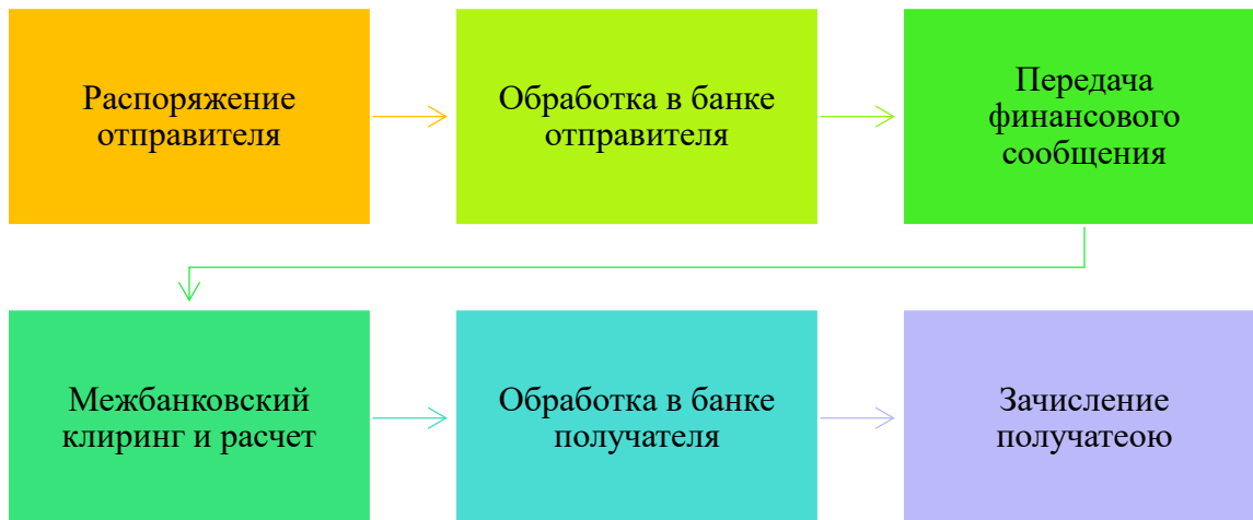
Рисунок 1 – Перевод денежных средств

Безналичные расчеты: от 3-х дней до онлайн, нужны банк и платежные инструменты, включает информацию о платеже, факт платежа фиксируется, комиссия за платежи, не надо считать вручную (нет сдачи), есть подтверждение платежа, кибератаки, этапы представлены (рис. 1).