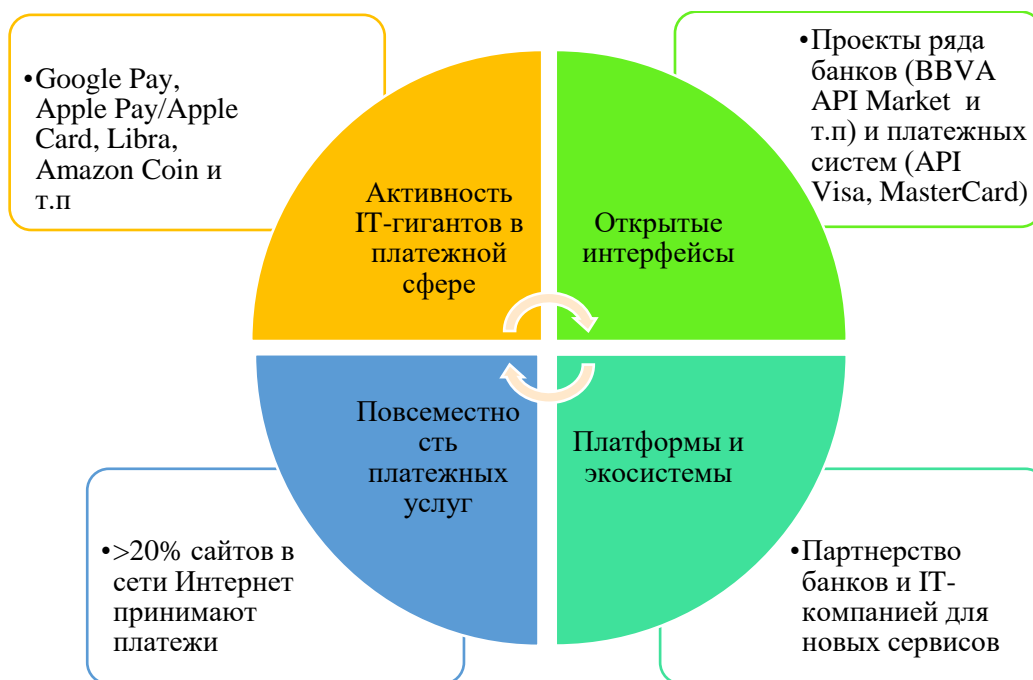
Рисунок 2 – Изменение клиентского опыта и моделей потребления

Таким образом, тренды таковы: более 50% трафика обычных пользователей потребляется с мобильных устройств (смартфоны и т.д.); количество мобильных телефонов в мире превысило количество активных банковских карт; интернет дает возможности быстрого поиска и сопоставления данных; возможность получения информации в режиме онлайн формирует потребность в моментальном осуществлении операций; время, затрачиваемое клиентом на выбор и совершение операций, становится основной ценностью [2].