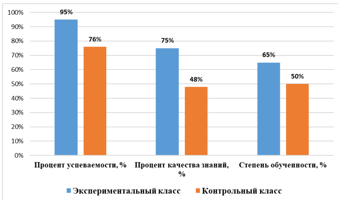
Диаграмма 2 - Результаты диагностики успеваемости и качества знаний контрольного и экспериментального класса

Из данных таблиц и диаграмм видно, что, процент успеваемости, качества знаний и степени обученности выше в экспериментальном классе. В классе с использованием кейс-технологии вырос уровень освоения учебного материала. Таким образом можно сделать вывод, что данная методика благоприятно влияет на успеваемость, качество знаний и степень обученности, при внедрении данной технологии у учеников появляется интерес к изучению химии.