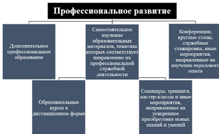
Рисунок 1 — Составляющие профессионального развития муниципальных служащих

Отдел кадров направляет управлению делами план ДПО и распоряжение о направлении муниципальных служащих на обучение. Управление делами заключает договоры с организациями, которые предоставляют услуги по образованию. На основании ФЗ № 44-ФЗ управление делами выбирает из 3 коммерческих предложений наиболее выгодное. Руководители отделов и департаментов могут сами предложить 3 образовательных учреждения, где им хотелось бы обучить своих сотрудников.