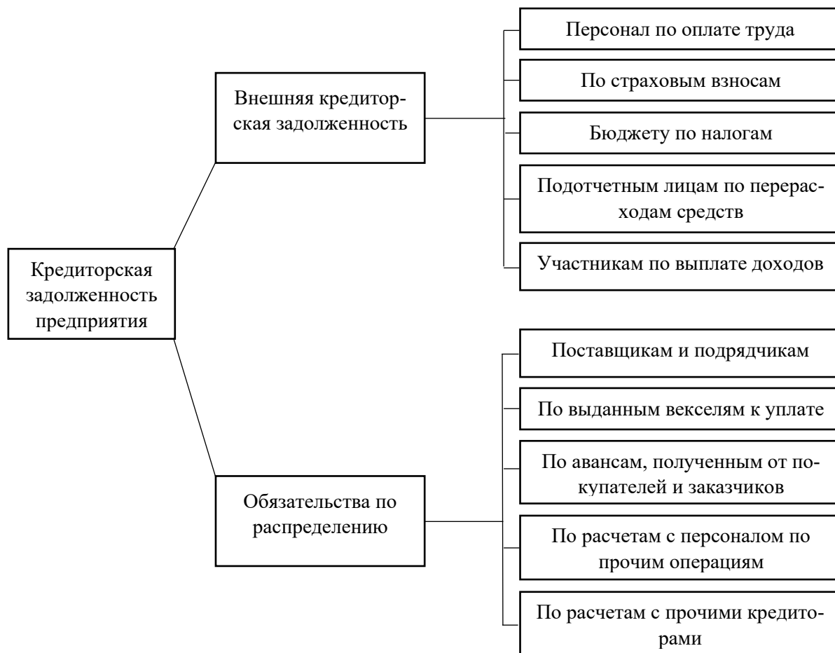
Рисунок 1.1 – Типология кредиторской задолженности предприятия

предпринимателями, физическими лицами и сотрудниками при расчетах, связанных с поставленными товарно-материальными ценностями, оплатой труда, платежами в бюджет. Она возникает, когда обязательства организации образуются раньше, чем была произведена их оплата [4]. На рисунке 1 изображена типология кредиторской задолженности.