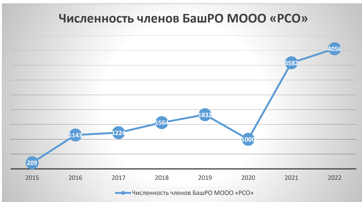
График 1 – Численность членов БашРО МООО «PCO»

Начиная с создания БашРО МООО «PCO» в 2015 году, численность членов РО PCO увеличивается, а это значит, что количество трудоустроенных студентов растет с каждым годом. Данную закономерность можно проследить на графике 1.