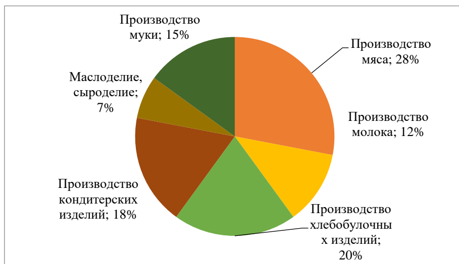
Рисунок 1 - Пищевая промышленность в Орловской области, 2021 г.

Исходя из этого, пищевая отрасль данного региона является достаточно привлекательной для инвесторов России и зарубежья. Поэтому орловские производители продуктов питания заинтересованы в освоении новых рынков сбыта продукции [3].