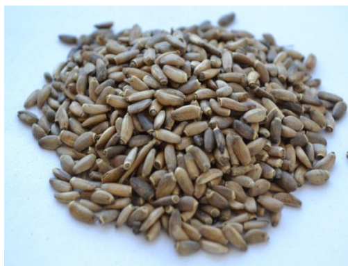
Рисунок 1 - Внешний вид семян Расторопши в условиях РСО-Алания

Семена представителей вида Silybum marianum . мелкие длиной 1-2мм. Окраска семян от светло - до темно-коричневого цвета.