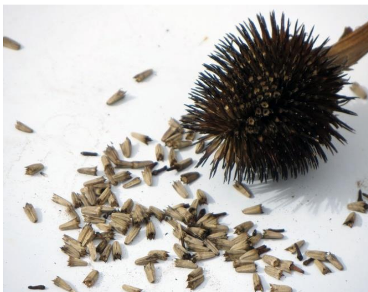
Рисунок 2 - Внешний вид семян Эхинацеи в условиях РСО-Алания

Семена представителей вида Echinacea purpurea мелкие высотой 90—100 см. Стебли прямые, шершавые.