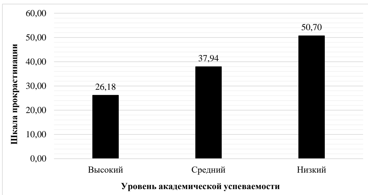
Рис. 2.2.1 - Выраженность прокрастинации у студентов с разной академической успеваемостью

наблюдаются низкие показатели прокрастинации (ср. знач. = 26,18). Это свидетельствует о том, что студенты данной группы, как правило, не откладывают выполнение учебных задач и обязанностей на потом.