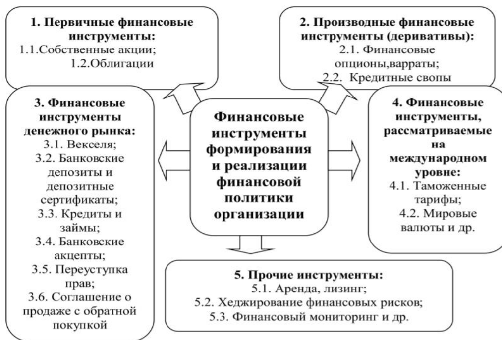
Рисунок 1 – Финансовые инструменты, формирующие и реализующие финансовую политику организации [6]

Для повышения эффективности работы организации особое внимание следует уделить безопасности финансов. Предприятие, используя ряд инструментов повышает уровень экономической безопасности. Менеджмент предприятия напрямую влияет на качество безопасности. Главная задача осуществления финансовой безопасности – преобразование финансовых предпосылок устойчивого роста. Для выполнения данной задачи в краткосрочной и долгосрочной перспективе упор идет на финансовую политику организации. В свою очередь финансовая политика представляет собой совокупность мер, которые направлены на привлечение денежных ресурсов, и последующее их применение для качественного развития [2]. Финансовые инструменты политики можно увидеть на рисунке 1.