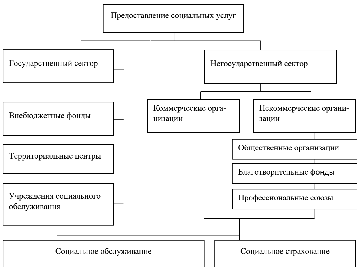
Рисунок 1 - Сфера социальных услуг Донецкой Народной Республики

В структуре сферы социальных услуг каждый сектор сферы социальных услуг относительно обособлен (рисунок 1).