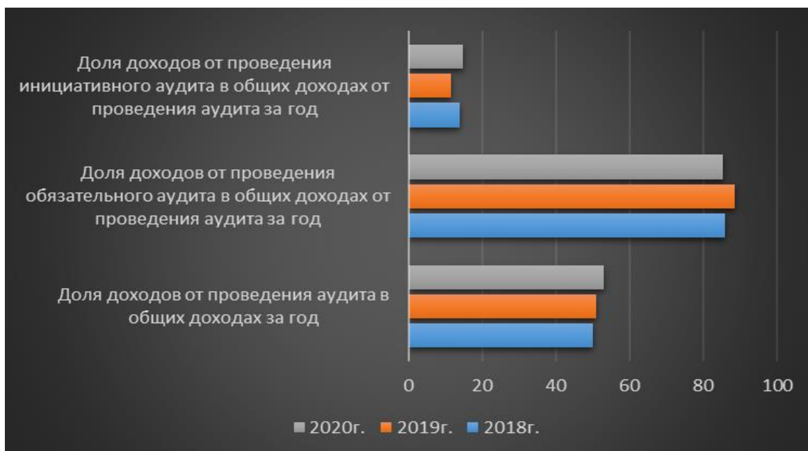
Рисунок 2 - Динамика распределения доходов аудиторских организаций в РФ

Наглядно данные таблицы продемонстрированы на рисунке 2.