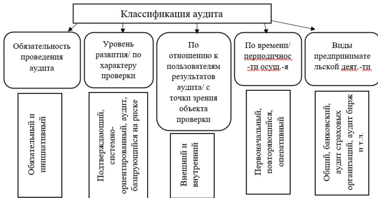
Рисунок 1- Классификация аудита

В настоящее время разные специалисты выделяют всевозможные классификации аудита. Рассмотрим основные из на рисунке 1.