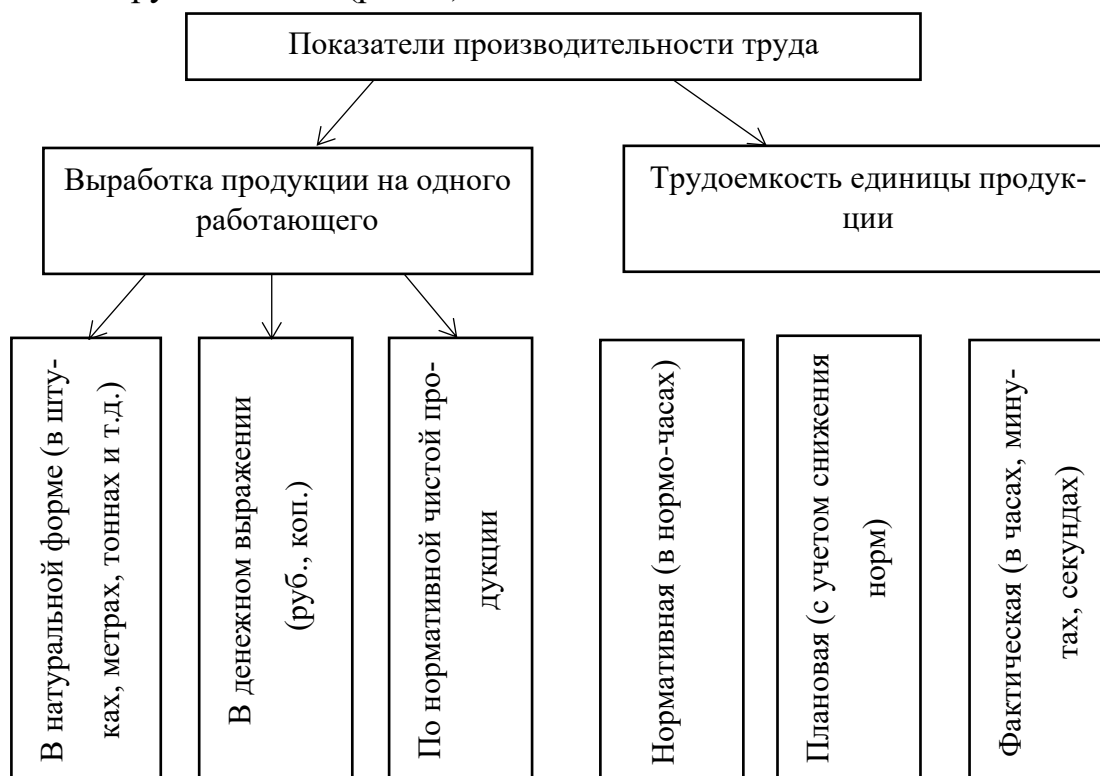
Рисунок 1 – Показатели производительности труда

Производительность труда – определяется количеством продукции, произведенной в единицу рабочего времени, либо затратами на единицу произведенной продукции или выполненных работ и рассчитывается через показатели выработки и трудоемкости (рис. 1).