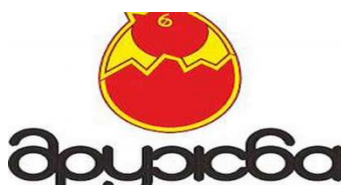
Рисунок 1 – Логотип предприятия ОАО «Птицефабрика «Дружба»»

На рисунке 1 представлен существующий логотип ОАО «Птицефабрика «Дружба»».