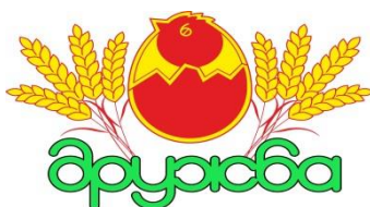
Рисунок 2 – Усовершенствованный логотип предприятия ОАО «Птицефабрика «Дружба»»

В новый логотип следует добавить колоски. Они будут показывать, что помимо производства продукции и реализации яиц предприятие имеет в своем составе 9 хозяйств, занимающихся выращиванием птицы. Колоски также будут символизировать традиции белорусского народа и аграрную направленность нашей страны. Готовый товарный знак со всеми элементами можно увидеть на рисунке 2.