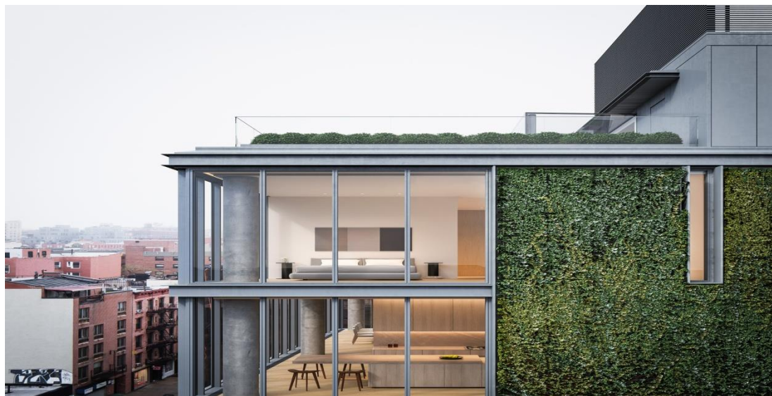
Рисунок 3 - Жилой дом 152 Elizabeth (США, Нью Йорк, архитектор Тадао Андо, 2014 г.)

озеленение диктует не просто выращивание различных растений на вертикальных поверхностях при помощи различных конструкций, служащих для украшения стен, изгородей, фасадов зданий. А является системой для выращивания различных растений при помощи всевозможных конструкций в вертикальном направлении, вне зависимости от плоскости произрастания растений.