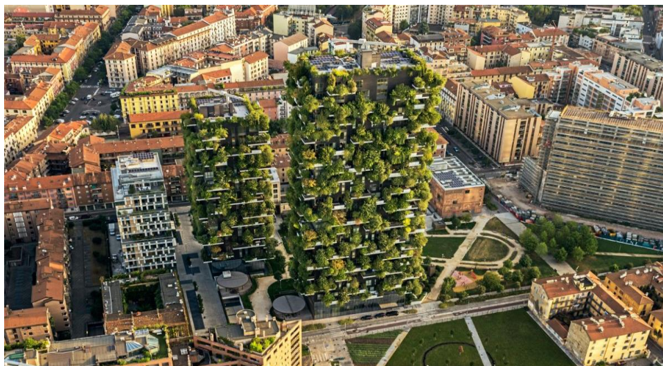
Рисунок 2 - «Вертикальный лес» в Милане (Италия)

1500 экземпляров одних только птиц и бабочек. Наличие растений, деревьев на террасах и балконах безусловно, оказали положительное влияние на человека, так как растения создали особый микроклимат. Зимой используется меньше тепла и это благодаря парниковому эффекту. А летом воздух прохладнее, тем самым происходит редкое использование кондиционеров.