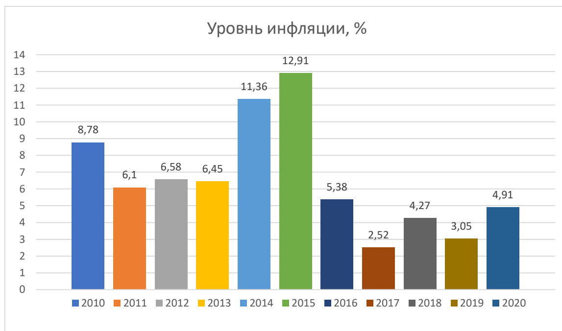
Рисунок 1 – Динамика уровня инфляции в РФ за период 2010-2020 гг. [2]

Контролирует уровень инфляции Росстат совместно с Центральным Банком России. Для анализа и оценки динамики инфляции в России рассмотрим коэффициенты инфляции за 10 лет, представленные на рисунке 1.