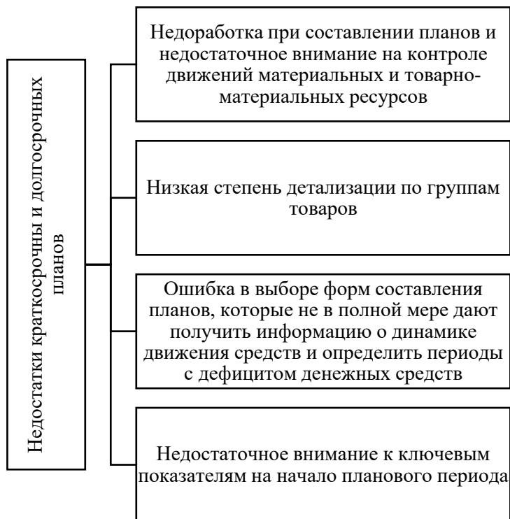
Рисунок 2 – Недостатки краткосрочных и долгосрочных планов

Финансовые проблемы часто связаны с недостатками краткосрочных и долгосрочных планов, которые отражены на рисунке 2.