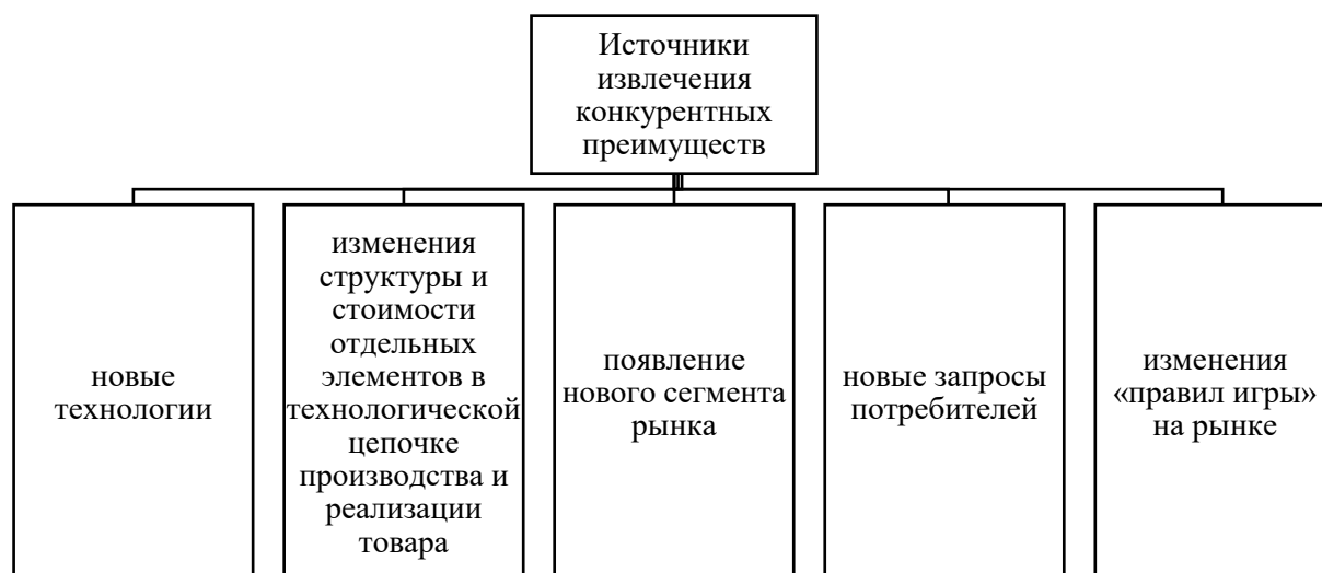
Рисунок 2 – Источники извлечения конкурентных преимуществ

Источники извлечения конкурентных преимуществ представлены на рисунке 2.