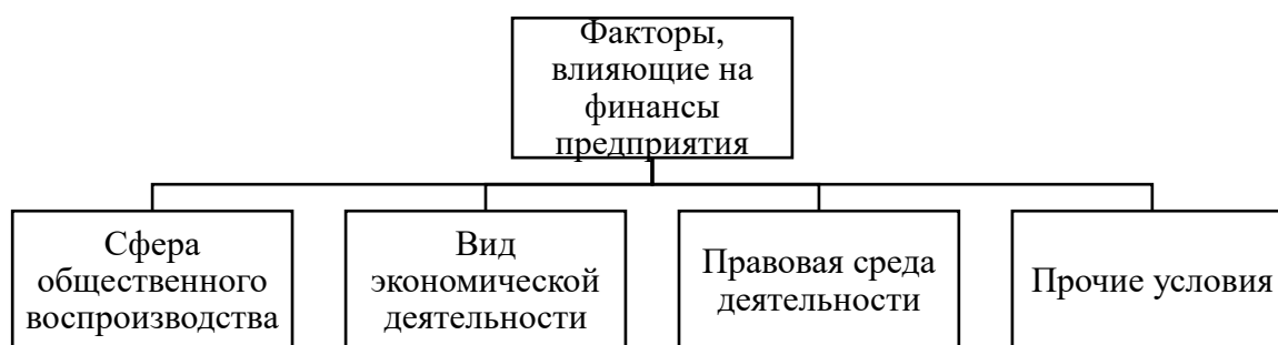
Рисунок 1 – Факторы, влияющие на финансы предприятия

На финансы предприятия оказывают воздействие факторы, представленные на рисунке 1.