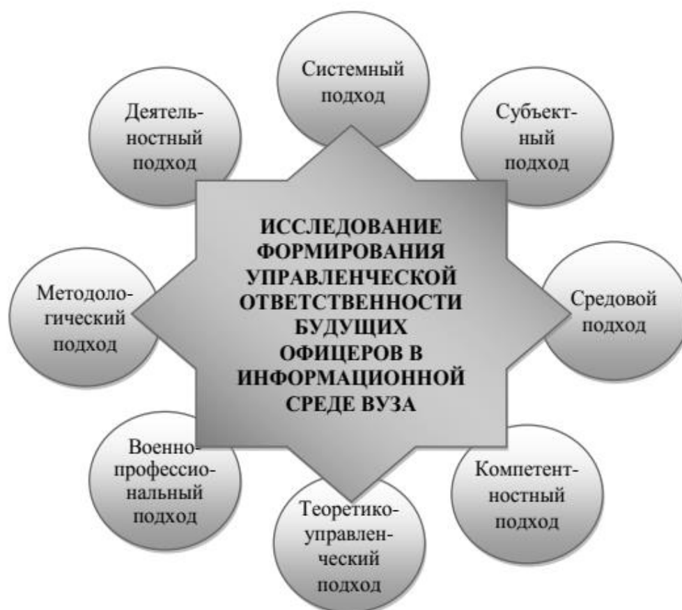
Рисунок 1 - Подходы к исследованию формирования управленческой ответственности будущих офицеров в информационной среде военного вуза

Однако формирование управленческой ответственности военных менеджеров происходит еще на стадии их обучения в военном вузе, когда преподаватель в рамках существующей информационной среды осуществляет образовательный процесс и через призму своего опыта воздействует на личность будущего военного специалиста. Следовательно, вопросы исследования формирования управленческой ответственности будущих офицеров являются достаточно актуальными и требуют применения подходов, которые приведены на рис. 1.