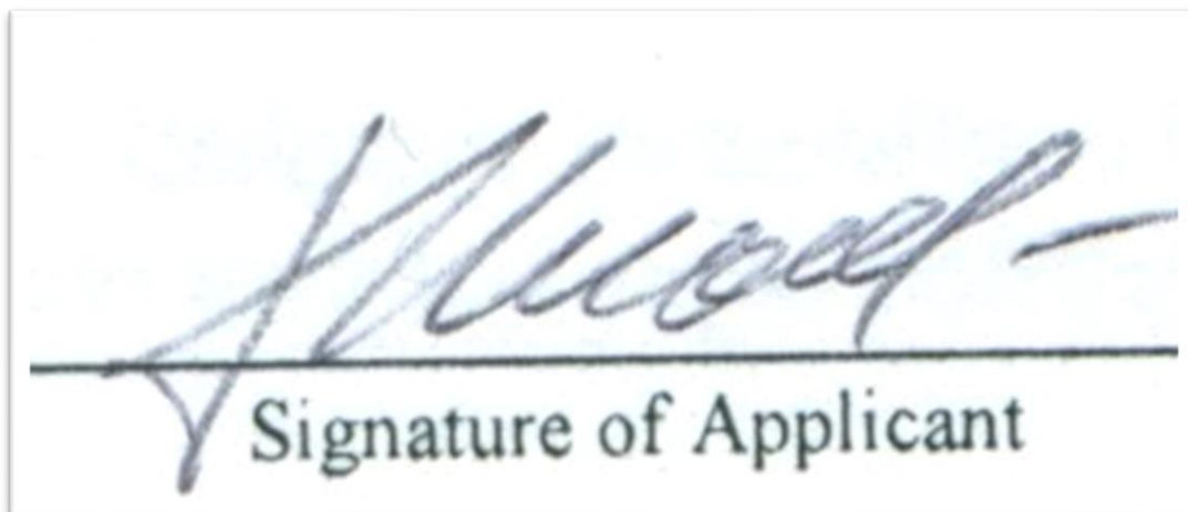
Рисунок 1 - Увеличенный фрагмент изображения, на котором видны артефакты JPG

В JPEG при сжатии изображение преобразуется из цветового пространства RGB в YCbCr. Сжатие по стандарту JPEG ведет к появлению на восстановленных изображениях. При высоких степенях сжатия, характерных артефактов: изображение рассыпается на блоки размером 8x8 пикселей (этот эффект особенно заметен на областях изображения с плавными изменениями яркости), в областях с высокой пространственной частотой (например, на контрастных контурах и границах изображения) возникают артефакты в виде шумовых ореолов. На рис. 1 наблюдаются артефакты светло синего цвета [1].