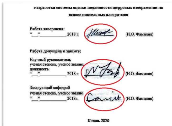
Рисунок 3 - Факты измененного документа, после контрастирования

В ходе тестирования разработанной системы, были проанализированы и произведены оценки 20 сфальсифицированных и 20 подлинных документов.