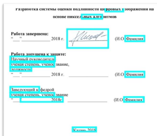
Рисунок 4 - Очерченные артефакты, появившиеся в ходе JPEG сжатия

Основываясь на полученных данных, обнаружены сфальсифицированные личные подписи. Откуда можно сделать вывод, что часть документов не является подлинными. Однако если программа выдает выделенные фрагменты, нельзя делать вывод о том, что изображение сфальсифицировано, так как артефакты могут возникать в ходе JPEG сжатия (рис. 4), то есть окончательное решение оценки подлинности изображения остается за пользователем.