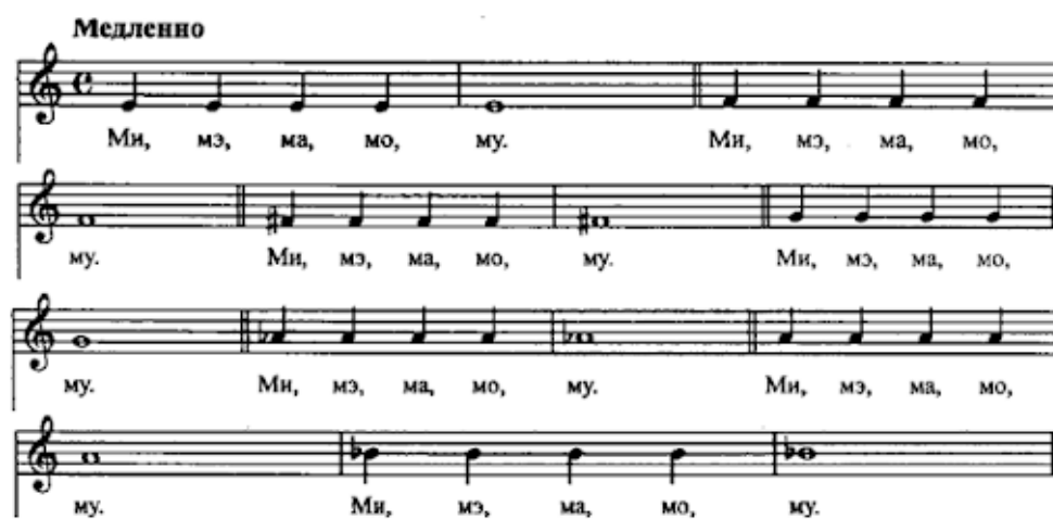
Рис. 1. Пение восходящей гаммы

Занятие начинается с распевок. Первоначально они поются на одном звуке на разные слоги: на секунду, терцию и квинту, сначала вверх, затем – вниз (Рис. 1). Возникает от вдоха натяжение в резонаторах, в легких, а также натяжение между диафрагмой и звуком. Все это должно производиться свободно, без напряжения. Умение дозировать дыхание помогает создать опору для звука и снять напряжение со связок и гортани. Согласные нужно произносить четко, певческие гласные должны звучать более округло и ровно, тогда голос звучит благородно – на этом основано знаменитое итальянское бельканто.