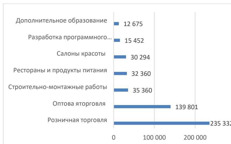
Рисунок 3 – Перечень наиболее популярные видов деятельности для ведения малого и среднего бизнеса в России за 6 месяцев 2019 г. и аналогичный период 2018 г.

На рис. 3 представлены популярные виды деятельности для ведения малого и среднего бизнеса в России за 6 месяцев 2019 г. и аналогичный период 2018 г.