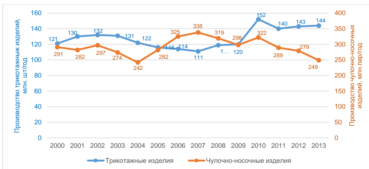
Рисунок 3. Динамика производства трикотажных изделий в России в 2000-2013 гг.

Представленные на рисунках 1, 2 и 3 данные, свидетельствуют о том, что при общем росте производства тканей в нашей стране производство одежды практически не растет, или растет совершенно неожиданным образом (как это видно на рисунке 2 в отношении производства платьев), а по большей части колеблется год от года безо всякой явно выраженной тенденции. Принимая во внимание вполне неплохую демографическую ситуацию (текстильные и швейные изделия являются товарами повседневного спроса), рост доходов населения, устойчиво сформировавшееся положительное отношение к привлекательному внешнему виду и внедрившиеся в сознание многих граждан требования дресс-кода для различных служебных и бытовых ситуаций – все это стимулирует к тому, чтобы граждане обзаводились довольно широким ассортиментом одежды в своем гардеробе и, казалось бы, стимулирует спрос на продукцию легкой промышленности вообще и швейной промышленности в частности, и казалось бы следствием должно стать активнейшее развитие этих отраслей промышленности. В действительности же все иначе [2].