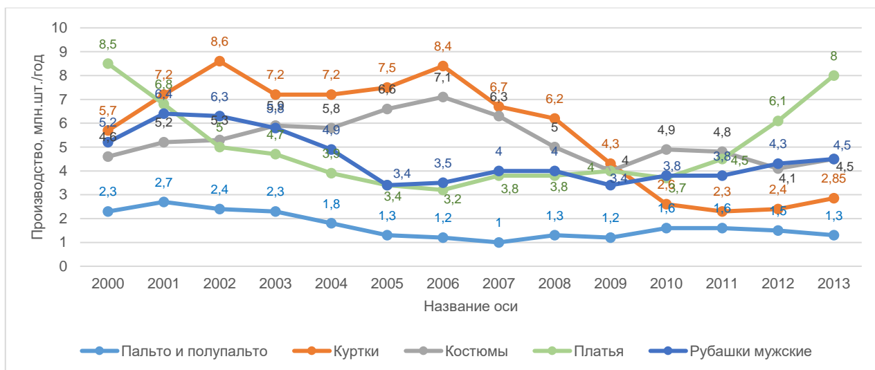
Рисунок 2. Динамика производства основных видов швейных изделий в России в 2000-2013 гг.