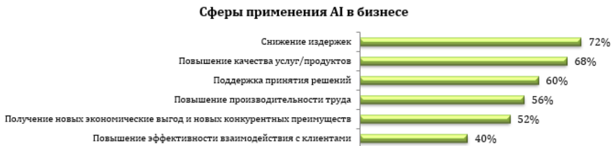
Рис.2 Опрос среди организаций о сферах применения AI в бизнесе

Рассмотрим более подробно механизмы использования искусственного интеллекта в бизнесе.