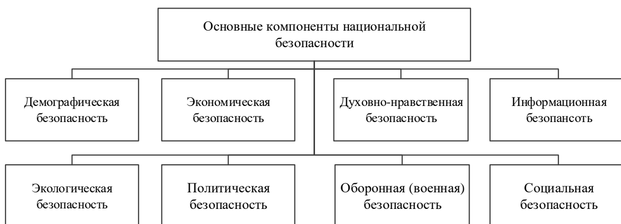
Рисунок 3 – Виды национальной безопасности

областям и сферам жизнедеятельности, в которых, собственно, проявляются такие угрозы. По такому принципу подразделены жизненно необходимые интересы, направления обеспечения национальной безопасности и угрозы в Стратегии национальной безопасности Российской Федерации [3]. Обобщенно схожую классификацию можно ограничить при помощи выделении нескольких наиболее ключевых видов безопасности, которые, в последствии, можно подразделять на более мелкие подвиды безопасности по конкретным областям жизнедеятельности (см. рисунок 3).