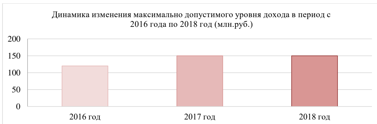
Рисунок 1 – Изменение допустимого максимума дохода при УСН

Уровень увеличения максимально допустимого уровня дохода организации, для применения УСН за последние 3 года представлена на рисунке 1.