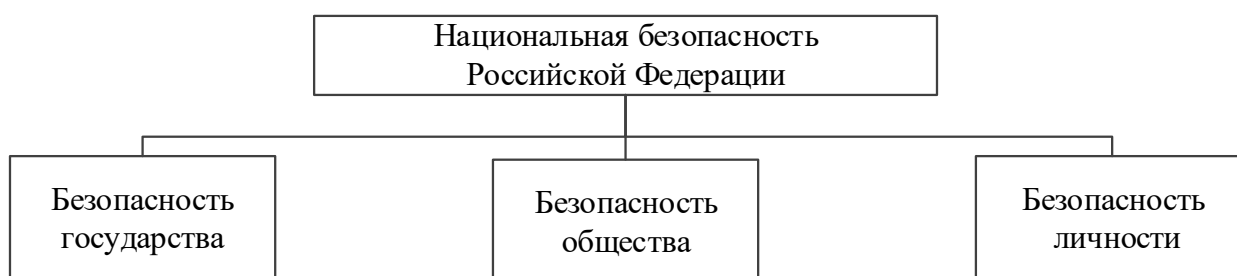
Рисунок 2 – Субъекты защиты национальной безопасности

Подходя к вопросу разновидностей национальной безопасности, следует понимать, что в рамках закона «О безопасности» закреплены основные объекты безопасности: безопасность государства (его конституционный строй, территориальная целостность и суверенитет), безопасность общества (его материальные и духовные ценности) и безопасность личности (ее права и свободы) (см. рисунок 2) [4, с. 33].