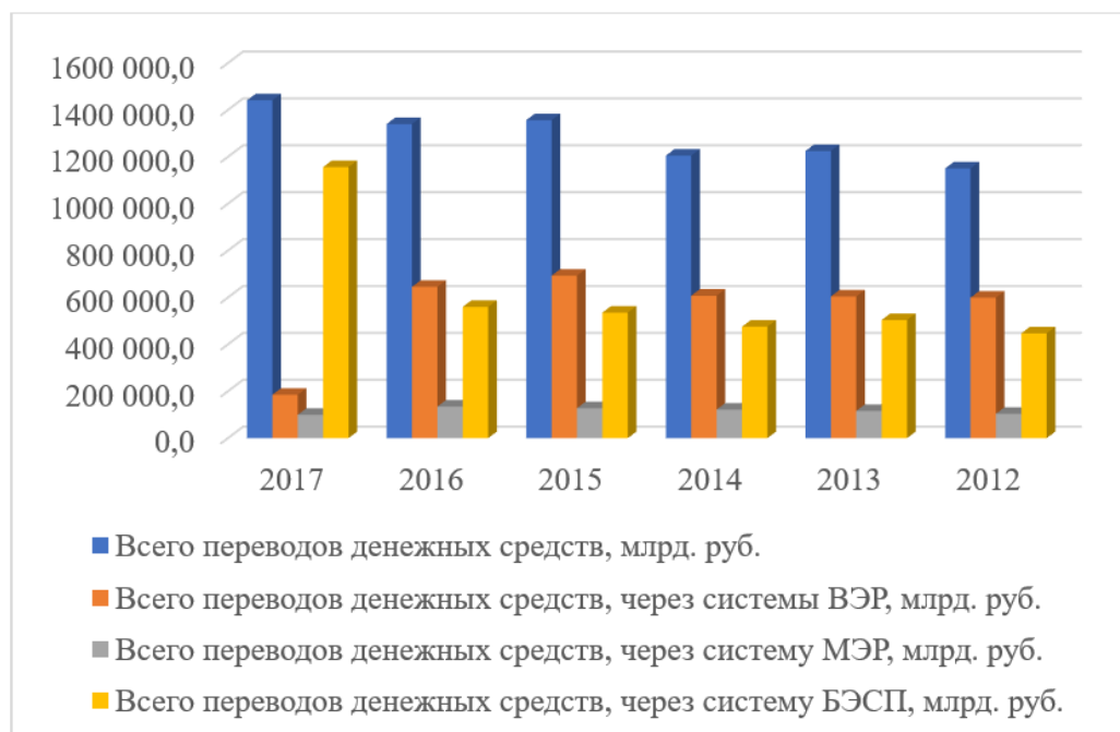
Рис. 1. Переводы денежных средств, осуществленные через платежную систему Банка России, по системам расчетов

Таким образом, каждая из вышеперечисленных систем выполняет свою роль в платежной системе Банка России, а их совокупность обеспечивает ее эффективное и бесперебойное функционирование.