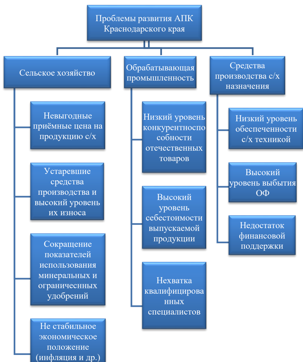
Рисунок 1. Проблемы развития АПК Краснодарского края

1. Большая эластичность производства, быстрое реагирование на изменение запросов покупателей и расширение ассортимента выпускаемой продукции. С учетом уменьшения сроков жизненного цикла продуктов по причине насыщения рынка и конфигурации потребностей потребителей, фирмы обязаны быстро перестраивать производство для покорения новых сегментов рынка. Это требует реализации инновационной стратегии становления производства, освоения новых товаров, увеличения их конкурентоспособности.