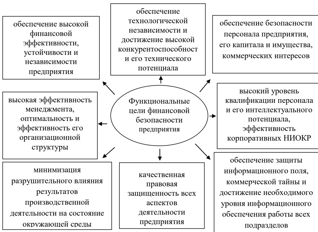
Рис.1. Функциональные цели финансовой безопасности предприятия [5, с. 32].

Из этой главной цели вытекают функциональные цели финансовой безопасности предприятия приведена на рис. 1.