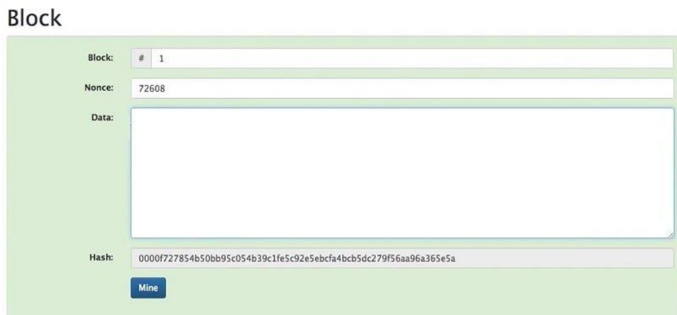
Рис 1. Пример блока блокчейна

Цепочка — группа связанных между собой блоков, идущих за собой в определенной последовательности. В цепочку входят все блоки, которые отвечают требованиям сети. В процессе формирования цепочки может возникнуть ветвление, когда один блок может стать «родительским» больше, чем для двух элементов.